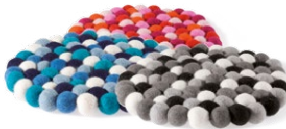
Sous-plat «Purnia» Un sous-plat décoratif et coloré, fait de petites boules de feutre assemblées. Réalisé à la main au Népal par ACP. Ø 22 cm, épaisseur: 2,5 cm. Rouge (NTG1), Bleu (NTG2), Gris (NTG3) Fr. 25.–

Découvrez notre FAIRSHOP à Weinbergstr. 24 (proche de la gare), à Zurich. Lu–Ve 11–18 h, Sa 11–16 h.