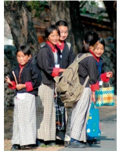
Tous les enfants du Bhoutan vont à l'école.

Comme le Bhoutan mise aussi sur un développement doux du tourisme, les voyageurs ont accès à la diversité de paysages naturels largement préservés. Et comme les responsables protègent délibérément le pays contre le tourisme bon marché, le tourisme est la principale source de devises malgré un nombre li-