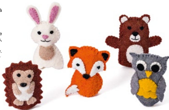
Marionnettes à doigts «Maila» Une série de marionnettes à doigts faites à la main en feutrine, formée d'animaux de la forêt. Produite au Népal par ACP. Set de 5 figurines: lapin, ours, hérisson, renard et chouette. Hauteur env. 8 cm. (NSZ3) Fr. 32.–