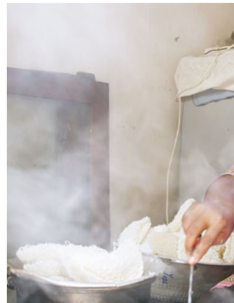
Aujourd'hui, W.T. Ganganika Namali livre aussi ses produits.