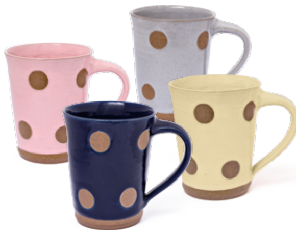
Tasse «Padmi» Tasse en céramique faite à la main. Formée sur un tour, séchée à l'air, vernie et cuite au four. Chaque pièce est unique. Produite au Népal par ACP. Ø 7–9cm, h: 10.5 cm Rose (NTN21), Jaune (NTN40), Bleu clair (NTN64), Marine (NTN60) Fr. 18.–

«La situation s'est maintenant améliorée, explique l'entrepreneuse sociale, mais les femmes au Népal ont toujours besoin d'être encouragées et soutenues. Elles ne doivent pas penser seulement au mariage et au ménage.» C'est pourquoi elle mise aussi sur des femmes dans le comité directeur d'ACP, où six des huit membres sont féminins, ce qui est très inhabituel pour le Népal. «Les femmes ont toujours démontré qu'elles sont de bonnes managers. Et quand les femmes gagnent de l'argent, il va à la famille. Quand les hommes gagnent de l'argent – qui sait à quoi il sert?» ○